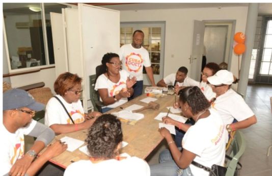
Het Inspectieteam aan de slag bij de NAAM

Op 20 maart 2015 heeft het Inspectiekorps, in het kader van teambuilding, de handen uit de mouwen gestoken voor het