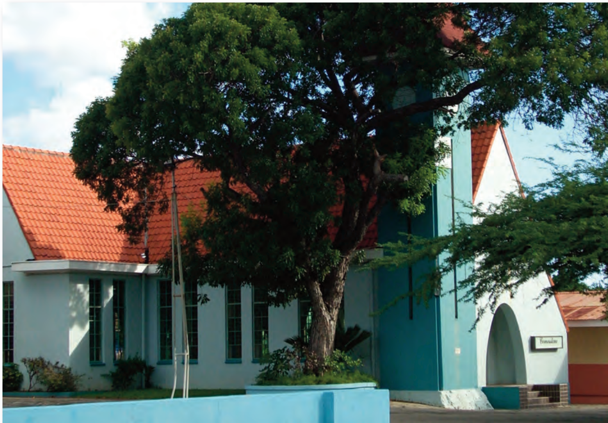
De 7th Day Adventist Church

In 2001 had 5.9% van de bevolking in de zone Mundo Nobo vertrekplannen. Hiervan was 22.2% in de leeftijd van 18-24 jaar.