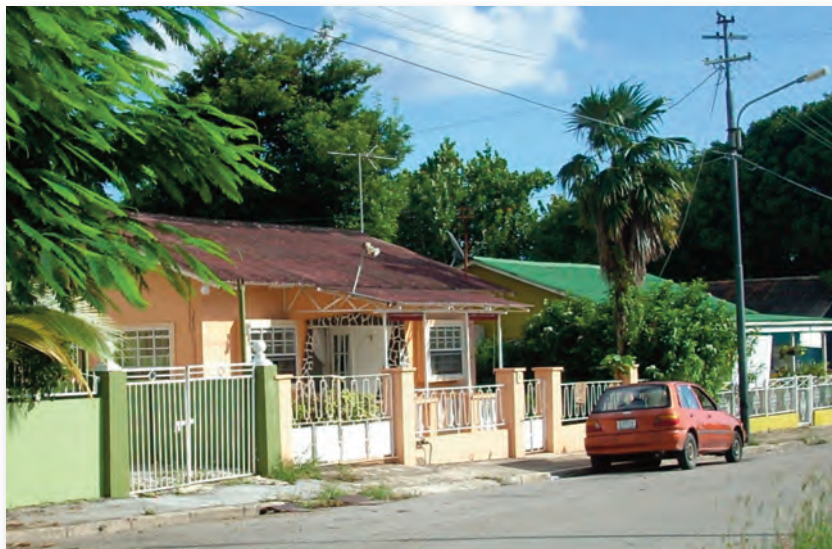
Straat met volkswoningen in Mundo Nobo

De hiernavolgende paragrafen geven een beschrijving van deze verschillende aspecten van leefbaarheid in de zone Mundo Nobo voor zover hierover gegevens beschikbaar zijn.