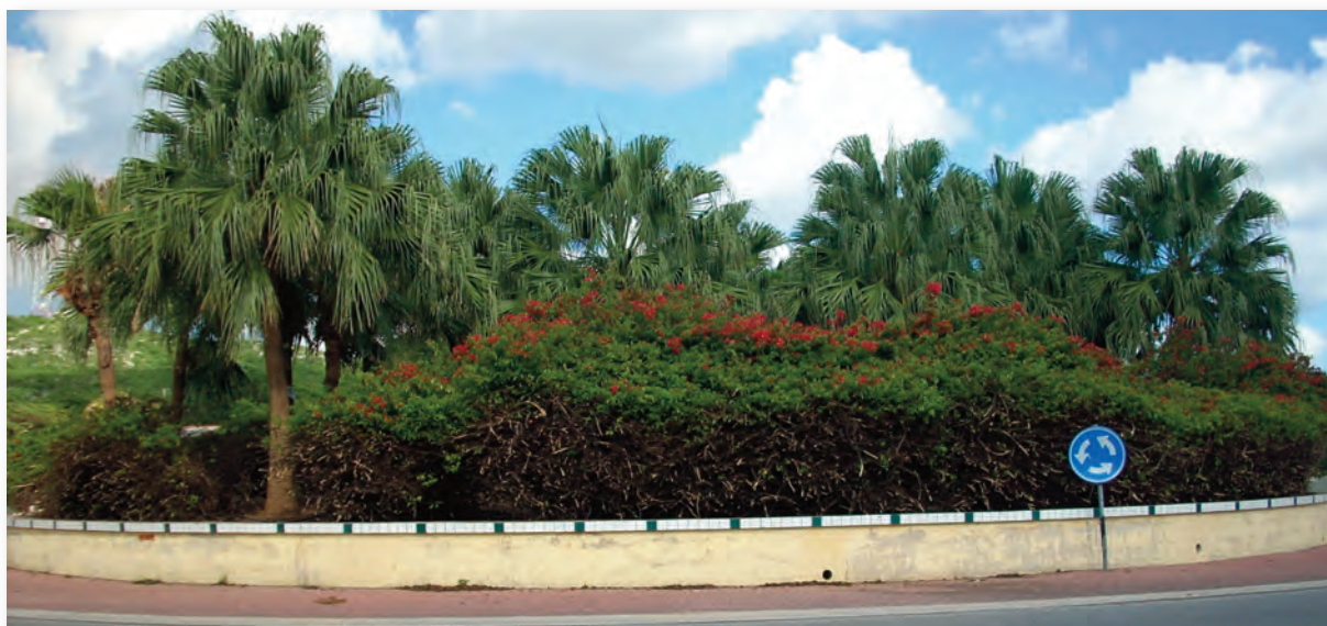
De Rotonde Betto Adames

Het percentage schoolbussers in de zone Mundo Nobo was in 1992: 3.2% en in 2001: 3.6%, terwijl het landelijk gemiddelde in 1992: 11.4% was en in 2001: 12.4%, veel lager dan het landelijk gemiddelde. Waarschijnlijk is onder andere de nabijheid van de onderwijsvoorzieningen in deze zone voor de schoolgaande kinderen een verklarende factor.