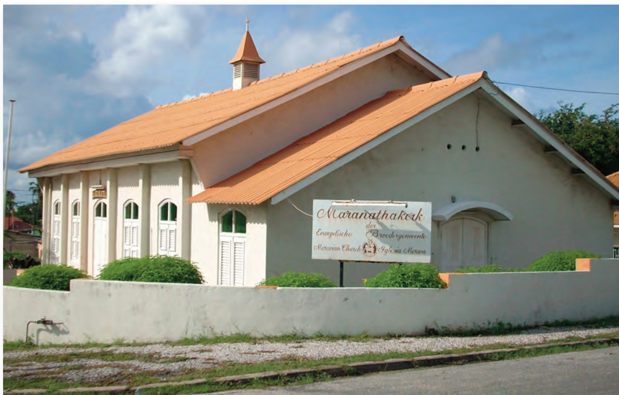
Maranathakerk a/d Goeroeboeroeweg