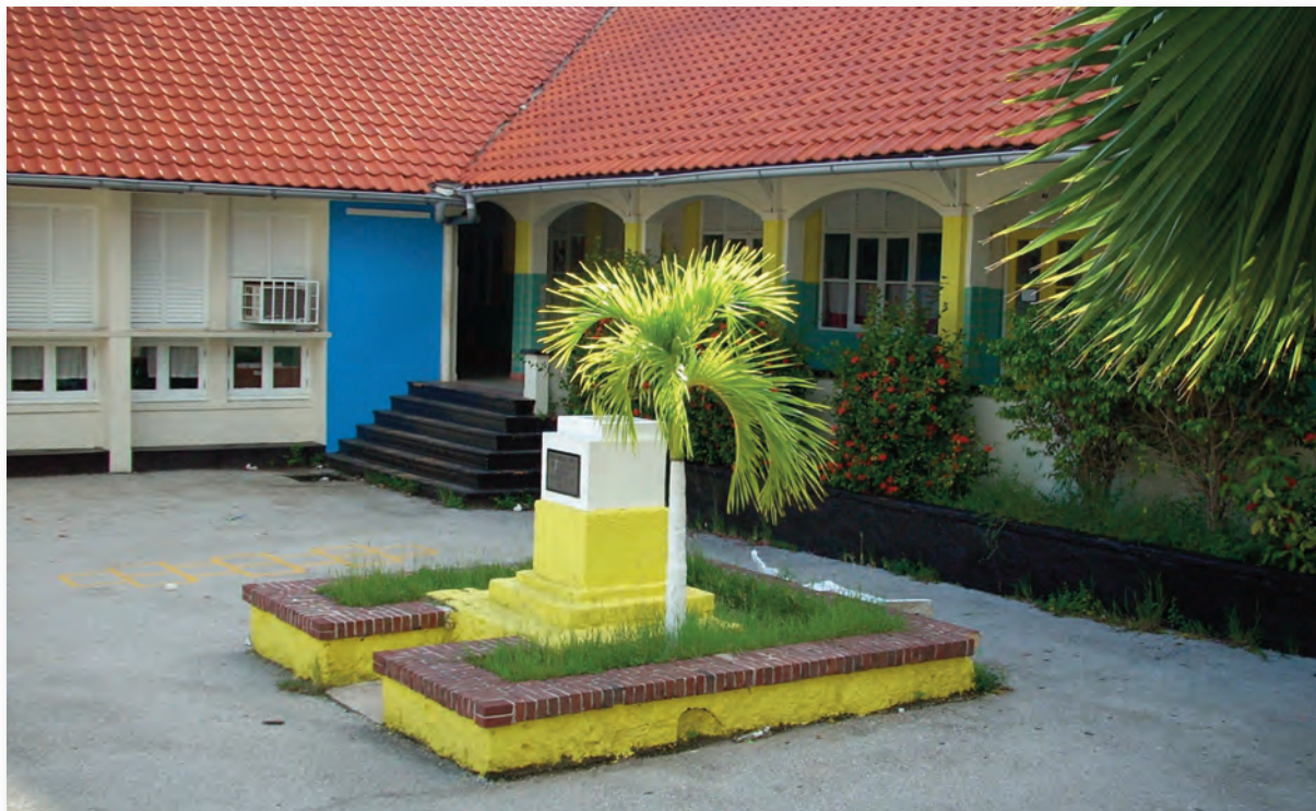
Patio Mgr. Nieuwindt College