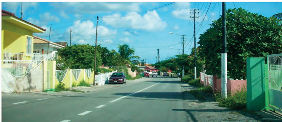
Zicht op Piscaderaweg, hoofdweg van Mundo Nobo

Uit gesprekken met individuele bewoners blijkt dat er een gemis is voor wat betreft sport- en spel. In de zone is er ook een gemis voor wat betreft andere voorzieningen voor vrije tijd zowel voor jongeren als ouderen.