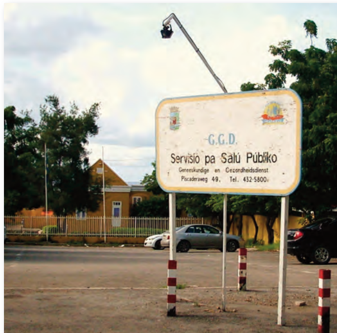
Het “oude” GGD-gebouw

In hoeverre andere factoren zoals de sociaaleconomische situatie van de huishoudingen, evenals hun gezondheidscultuur een rol spelen moet door verder onderzoek nader vastgesteld worden.