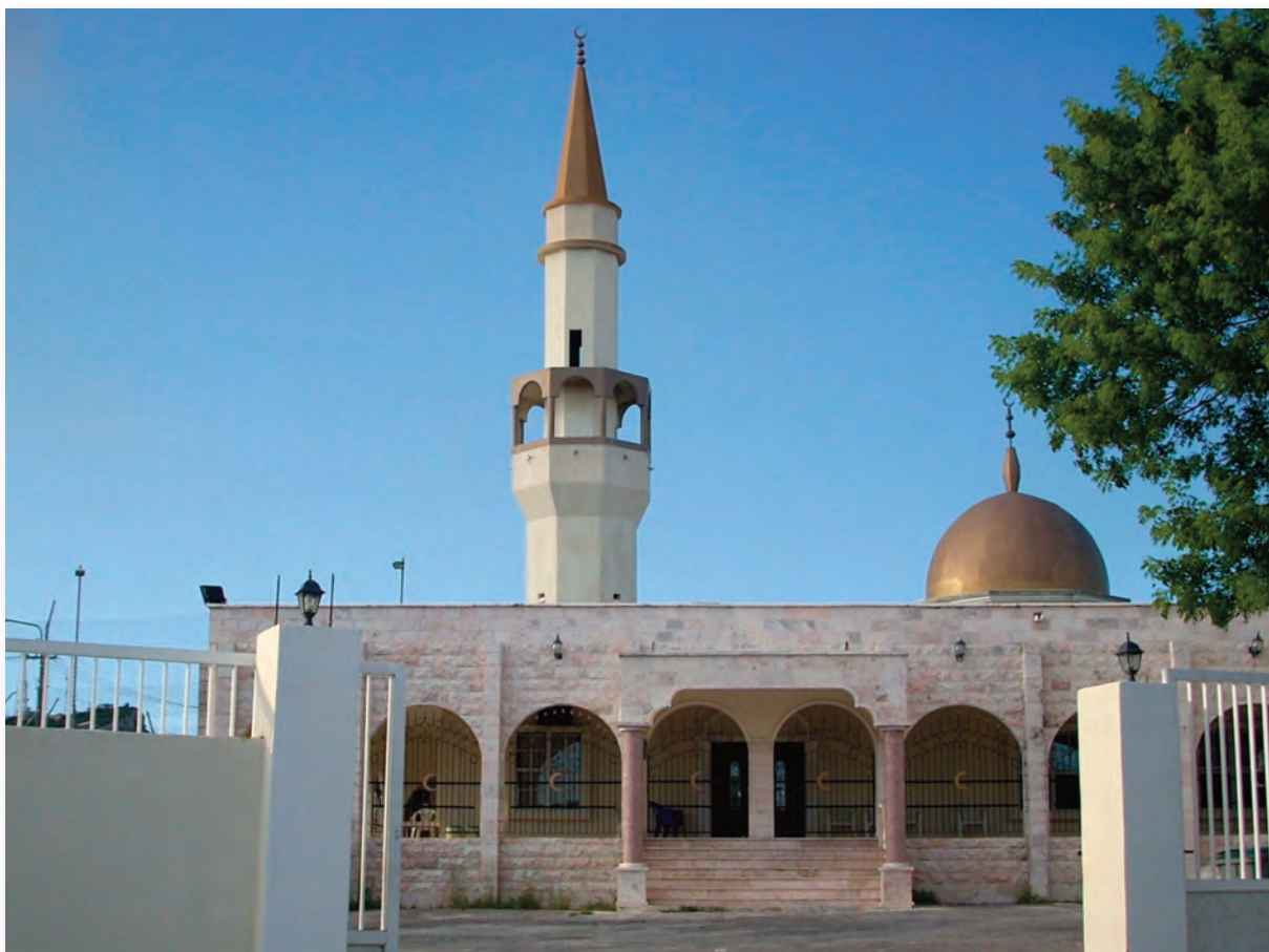
Islamic Center op grens Baraltwijk