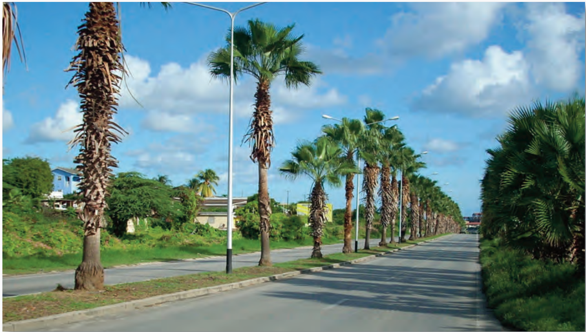
EEG-weg tussen Aqualectra en rotonde Betto Adames

Op zon- en feestdagen geldt een afwijkende route