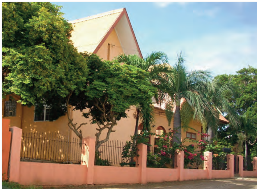
Hooggelegen woning aan de Charoweg

Volgens bovenstaand tabel is het aantal huurwoningen per 100 eigendomswohnungen in de periode 1992-2001 gedaald met 13. Dit aantal is in 2001 minder dan het landelijk gemiddelde van 44.