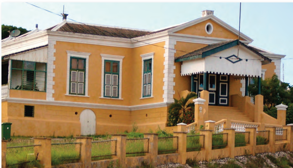
Oud militair hospitaal te Plantersrust.

Zone Mundo Nobo dankt haar naam aan het gebouw van het huidige Curaçaos museum. Dit gebouw dat rond het midden van de 19de eeuw dienst deed als militair ziekenhuis, stond bekend onder de naam 'Mundo Novo'. In 1892 werd een nieuw militair hospitaal gebouwd op een heuvel op het terrein van plantage Plantersrust, die toen in handen van het gouvernement was. Dit gebouw is een aantal jaren geleden gerestaureerd en behoort nu tot een van de fraaie historische gebouwen van Curaçao.