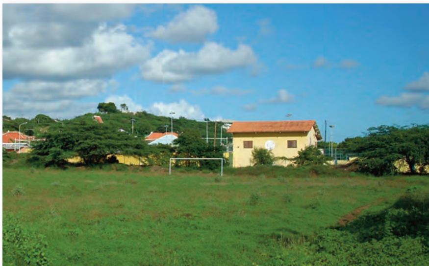
Door wildgroei overwoerd sportveld in Mundo Nobo

In de zone Mundo Nobo zijn er relatief weinig sportgelegenheden en accommodaties. Jongeren in deze zone zijn daarom aangewezen op faciliteiten in de nabijgelegen wijken.