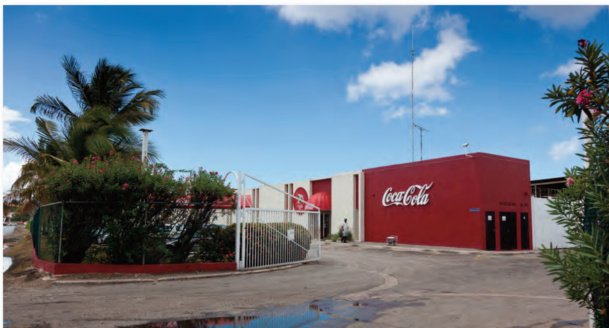
Free Zone (1956 – heden)

Met haar 120 man tellende personeelsbestand zet het bedrijf geen stempel in de zone voor wat betreft in het aantal werknemers dat zich dagelijks van en naar de fabriek begeven. Maar wel drukt het bedrijf als oudgediende al geruime tijd een stempel op de zone met haar opvallende logo op de fabriek en op haar vrachtwagens.