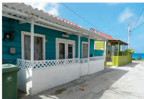
Goed onderhouden houten huizen bij 'Hala Kanoa'