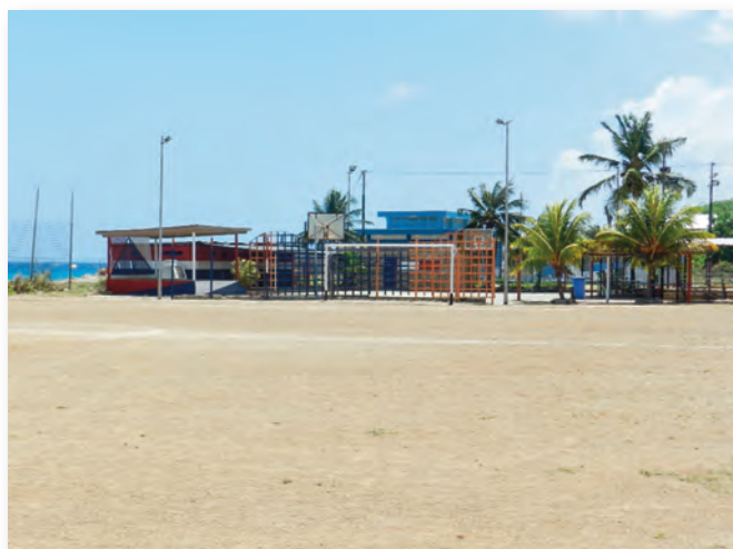
Voetbalveldje annex Bola Kriyoyo Bak

Van genoemde sportvormen wordt slechts de voetbal- en zwemsport bedreven in zone Steenrijk. De enige sportfaciliteiten in zone Steenrijk zijn een eenvoudig voetbalveldje zonder kleedkamer met annex een 'Bola Kriyoyo Bak'. Beide faciliteiten liggen aan de zee kant in de wijk Marie Pompoen, schuin tegenover de Rotterdamweg. Volgens burens wordt regelmatig op het veldje geoefend door jongeren gedurende de week. De 'Bola Kriyoyo' heeft echter veel betere tijden gekend. Nu wordt sporadisch gebruik gemaakt van deze faciliteit. De hoofdreden hiervoor is het feit, dat er geen leiders en vrijwilligers meer zijn zoals vroeger. In de wijk Marie Pompoen ligt ook de Playa Mare Pompoen. Opvallend is dat niet veel bewoners van de eigen wijk en zone gebruik schijnen te maken van deze baai. Dit is uit gesprekken met plaatselijke informanten gebleken.