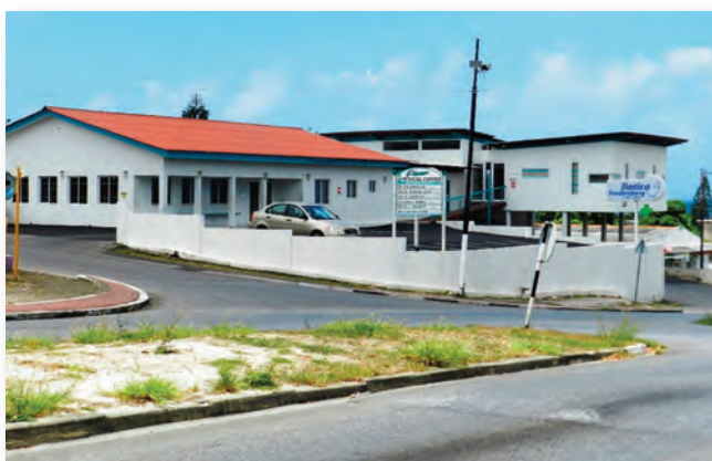
Sentro Médico Plexus en Botika Vredenberg op de achtergrond

De 'gezonde wijken' benadering is gebaseerd op de uitgaansgedachte, dat actieve deelname van de mensen, bijdraagt aan hun persoonlijke ontwikkeling en aan het versterken van beoordeling- en beslissingvermogens, die op hun beurt weer de intermenselijke relatie positief beïnvloeden. In dit opzicht is de situatie van Steenrijk in principe niet positief te noemen. Er is namelijk wegens omstandigheden weinig sprake van daadwerkelijke collectieve deelname, hetzij actief of passief, aan o.a. sociaal-culturele en sportactiviteiten.