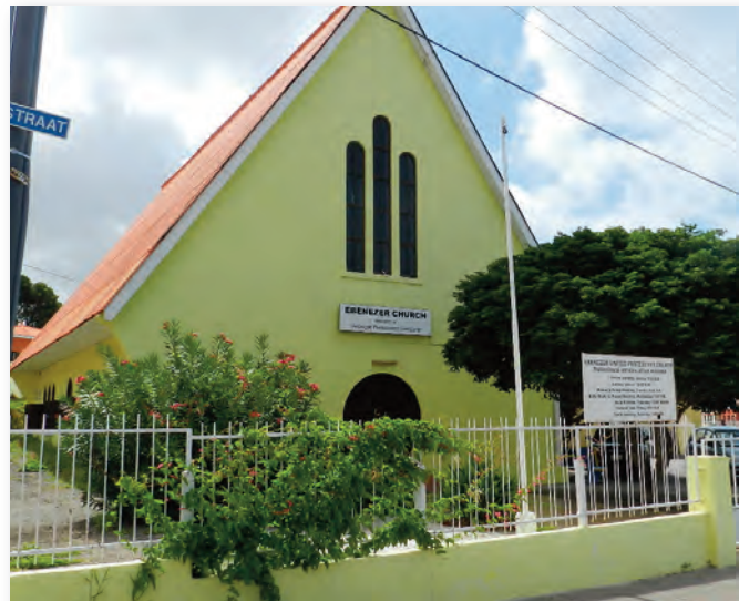
The Ebenezer Church