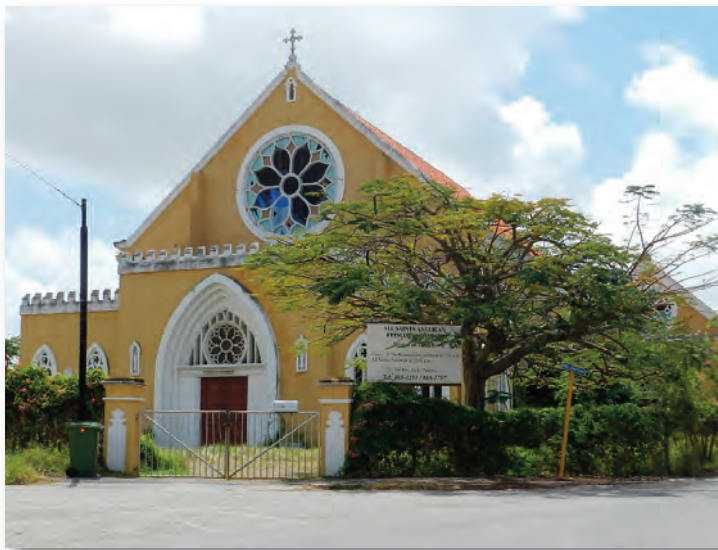
The Anglican Church