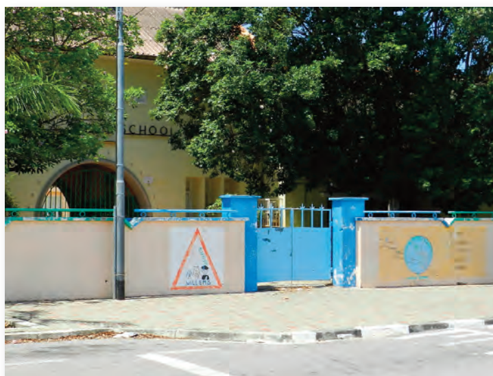
De Kolegio Chaya Willems aan de Dr. L.M. King Boulevard