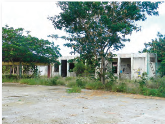
Ruines vroegere Buurtcomplex Dividivi