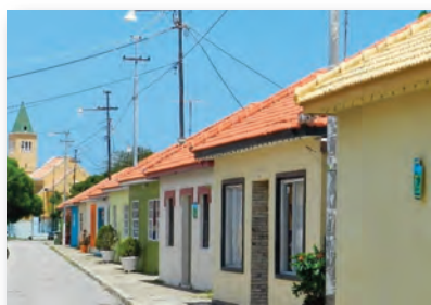
Particuliere volksbondwoningen met kerk op achtergrond

Volgens respondenten kent Steenrijk momenteel geen woningnood. Vooral na de grote trek naar Nederland in de jaren '90, toen verschillende woningen beschikbaar werden. Steenrijk kan slechts gedeeltelijk als een schone zone beschouwd worden. Een aanzienlijk aantal erven en een kleiner aantal straten in bepaalde volkswoningwijken zijn namelijk aan een degelijke schoonmaak toe, terwijl de meeste “pleinen” er zeer verwaarloosd uitzien. Aan het einde van de Kaya Adawama in de wijk Kustbatterij is zich een kleine vuilnisbelt aan het vormen bij de ruïnes van de vroegere kustbatterij. Dit is ook het geval achter de Elmesstraat bij de ruïnes van het vroegere Buurtcomplex Dividivi.