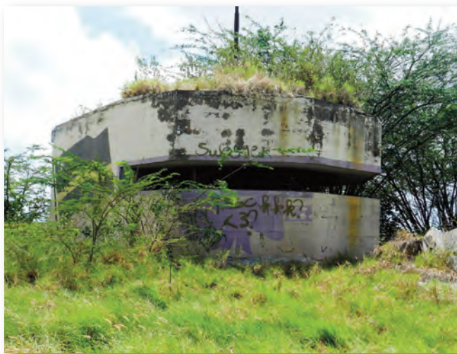
Ruïne van de Kustbatterij waar drugs werd verkocht

Zowel de Rotterdamweg en omgeving als de wijk Kustbatterij, zijn momenteel vrij rustige buurten. De situatie in de wijk Steenrijk is echter geheel anders. Vooral in het westelijke gedeelte van de wijk, dat aan de Penstraat grenst. Informanten hebben het over drugsgebruik en drugsverkoop bij klaarlichte dag, over inbraken en het leeghalen van woningen en overvallen die bij tijd en wijle voorkomen. Eind verleden jaar is een barbecuetent tot tweemaal toe overvallen in de Scheveningenstraat, eerder dit jaar is een Nederlands paar overvallen en mishandelt, terwijl twee weken geleden een jonge man vermoord is op de hoek Sittardstraat/Penstraat. “Er heerst een soort angstpsychose in dit deel van de wijk”, merkt een informant op.