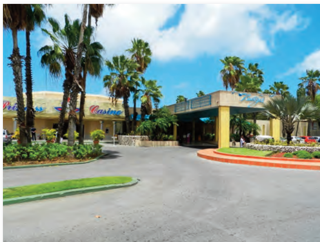
Hotel Breezes en Casino