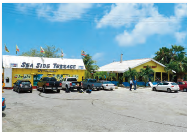
De Sea Side Terrace naast de Surf en Turf

Steenrijk heeft alle karakteristieken van een moderne zone met geldautomaten, pompstation, brandweer, snacks, toko's, minimarkets, supermarket, Mall, hotels en pensions, winkels, bar/restaurants van verschillende sterren en kookculturen, bakkerij, fotostudio, kapsalon, tire service, medisch centrum, laboratorium, prikcentrum en een apotheek of botika. De Botika Vredenberg valt niet direct binnen zone Steenrijk, maar is hier slechts twee straatnummers van verwijderd. Verder beschikt de zone over twee duikscholen, te weten 'The Dive Bus' en de 'Twindivers'. Ook is er een publieke baai genaamd Playa Marie Pampoen. Hier staan twee bekende strandrestaurant van plaatselijke ondernemers: De Sea Side Terrace en de Surf and Turf.