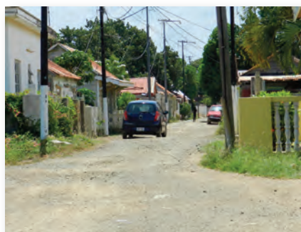
De niet geasfalteerde Ijmuidenstraat met houten huizen

Het probleem zit hem in het feit dat het hier geen overheids- of eigendomsgronden betreft, doch gronden die vroeger in huur zijn afgegeven aan de mensen. Usance is dat soortgelijke gronden buiten de beleidsverantwoordelijkheid van de Overheid vallen.