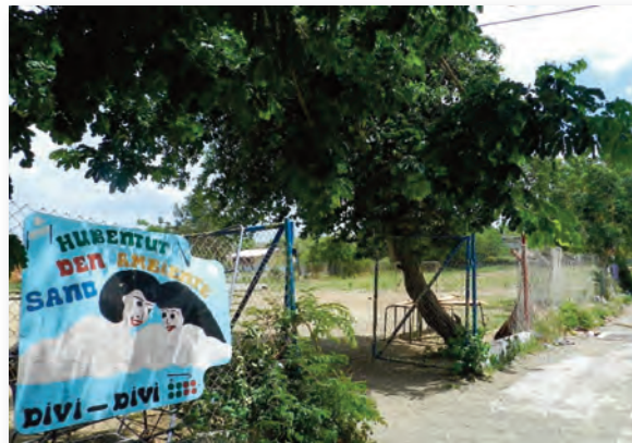
Bescheiden veldje Hubentut den Ambiente Sano

Culturele activiteiten komen vrijwel niet voor in zone Steenrijk; met uitzondering van de viering van de Dag van de Vlag op 2 juli georganiseerd door 'Bisiñanan Kontentu di Bond' in de Pater Lodovicus Jansenstraat. Ook is er een kerkkoor dat regelmatig oefent en in de kerk optreedt. Soms zingt men ook in kerken in andere zones.