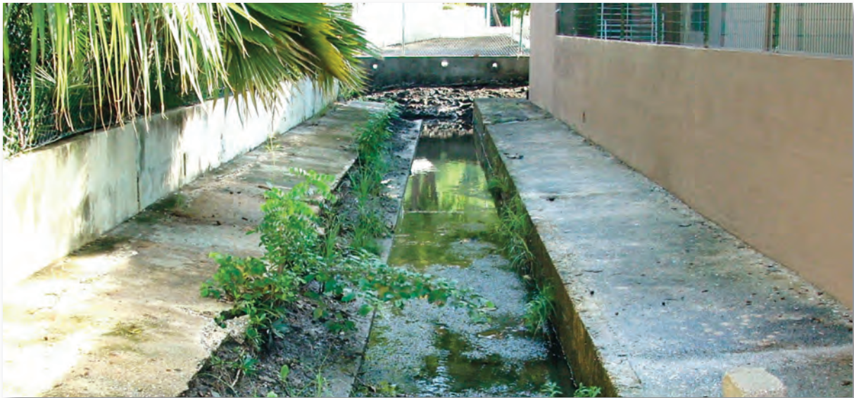
Rooi in de Groot Davelaarweg