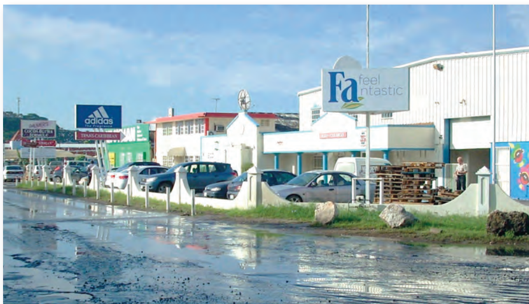
Wateroverlast in de Kaminda André Kusters in Zeelandia

Nederlanders en Surinamers woonachtig. Het was voor de stadsmensen toen nog kunuku en de wegen bleven enige tijd onverhard. Het gedeelte tussen de Erieweg en de Nieuwe Haven was een zogeheten 'veld' dat meestal onder water kwam te staan bij zware regenbuien. De grond bevatte sporen van zout en het grondwater was brak. Waarschijnlijk dat daardoor in dit gedeelte geen agrarische activiteit voorkwam. In de jaren 70 ondervond de wijk een grote verandering met name doordat de Nieuwe Haven toen tot meer activiteit kwam en er een wegaansluiting werd aangelegd. De straten werden in de jaren 60 geasfalteerd en er kwam ook straatverlichting. De wijk raakte vol met ongeveer 70 woningen.