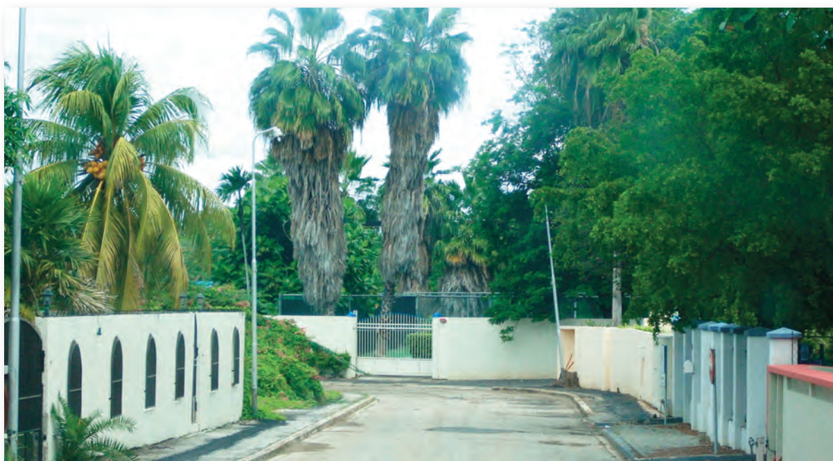
Exotische tuin in de Scalaweg

Het gedeelte langs de Nieuwe Havenweg wordt ingenomen door achtereenvolgens een kantoor (bank), een grote hardware zaak, een modern kantoorgebouw (KPMG), het voormalige en nu verlaten complex overheidskantoren, het gebouw van de vakcentrales (AVVC) en de torens van het Pensioenfonds (Kantorencomplex APNA Plaza). Ook staan daar het sterk verwaarloosde gebouw van de Schouwburg en de bijbehorende parkeerplaatsen. Langs de Fergusonweg, de Rooi Catootjeweg en de Schottegatweg is er sprake van een sterke ontwikkeling naar meer kantoorgebouwen van, onder meer, medische specialisten.