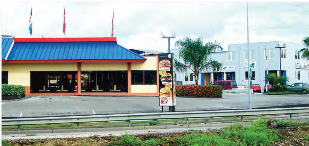
Beeld van Burger King en Multi-Post

Wij hopen dat een ieder die geïnteresseerd is in deze zone baat zal hebben bij dit buurtprofiel.