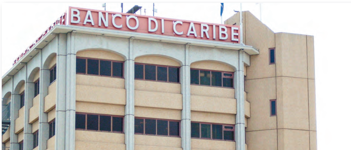
De Banco di Caribe

Was oorspronkelijk een zeer kleine plantage of tuin met een landhuis, welke afgebroken is. Op deze plek is het hoofdkantoor van de Banco di Caribe verrezen en dit gebouw bepaalt het gezicht van deze kleine wijk. Het is vanaf de jaren 40 een woonwijk voor de middenstand geworden maar de laatste 30 jaren is de druk van het verkeer steeds groter geworden evenals de vraag naar commerciële locaties. Hierdoor is deze kleine wijk steeds verder gecommercialiseerd en vanaf de jaren 90 is de woonfunctie voor een groot deel verdwenen. Het gedeelte waar nog de meeste woningen staan is te vinden tussen de Uranusstraat en de Saturnusstraat. De vraag is natuurlijk voor hoelang nog. De wijk wordt begrensd door de Mercuriusstraat, de Saturnusstraat en de Perseusweg. Ook hier is een aantal aspecten van het buurtonderzoek minder relevant door het verdwijnen van de woonfunctie en het buurtgevoel.