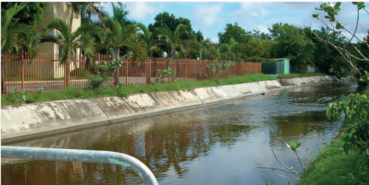
Rooi te Pos Cabai