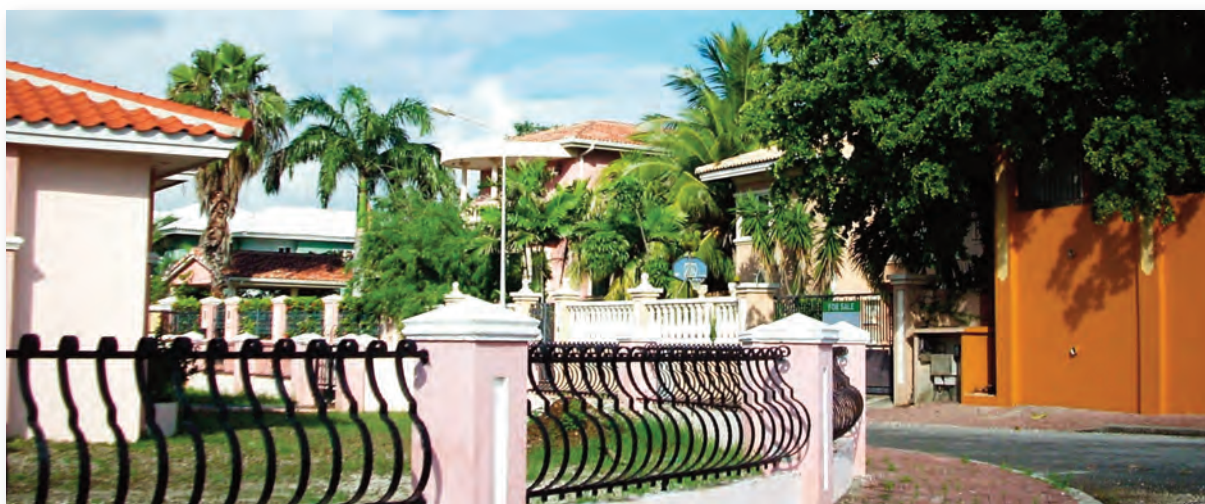
Wijk in Pos Cabai / Zeelandia

In Zeelandia is de verhouding in 1992 ook ongeveer gelijk aan de Curaçaose situatie, terwijl in 2001 de verhouding praktisch één op één is geworden. Dus het aantal huurwoningen is relatief gestegen ten opzichte van de eigendomswoningen.