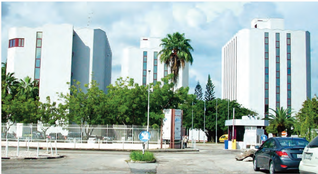
Het APNA-complex aan de Schouwburgweg