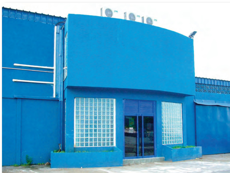
De Tropical Bowling Club te Zeelandia

Uit de buurtmonitor van 2007 blijkt dat het percentage van mensen van 4 jaar en ouder in de twaalf bestudeerde wijken in de buurtmonitor, die aangeven minstens 1 keer per week te sporten, 19,4% is. Voor de zone Zeelandia zijn geen harde gegevens beschikbaar, maar volgens de respondenten zijn er geen of nauwelijks wijkgebonden activiteiten op sportgebied. Er zijn wel sportfaciliteiten in de zone (wijk Zeelandia), maar de meeste sportbeoefenaars uit de zone kunnen makkelijk terecht in de naaste omgeving. Men selecteert de eigen sportactiviteiten en rijdt dan naar de desbetreffende faciliteit toe. De zone heeft verder geen eigen teams voor balsporten en dergelijke. Er zijn ook geen sportvelden, wel een bowling faciliteit en een spa.