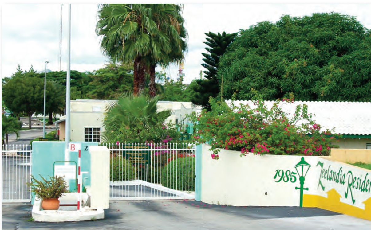
Beeld van Zeelandia Residential Park

Bij de buurtmonitor in de bestudeerde 12 buurtmonitorwijken is ook geprobeerd het oordeel van de bewoners van de bestudeerde wijken te meten voor wat betreft de “sfeer” (het leefklimaat) en de “sociale integraliteit” in hun omgeving. In de wijken van de buurtmonitor van 2007 zijn de mensen voor bijna 80% positief over zowel de sfeer en de sociale integraliteit van hun wijk.