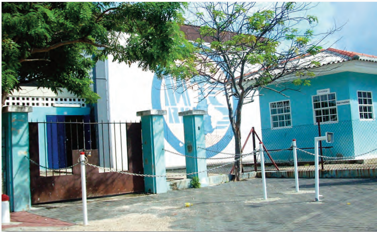
De ingang van de MTS te Groot Davelaar