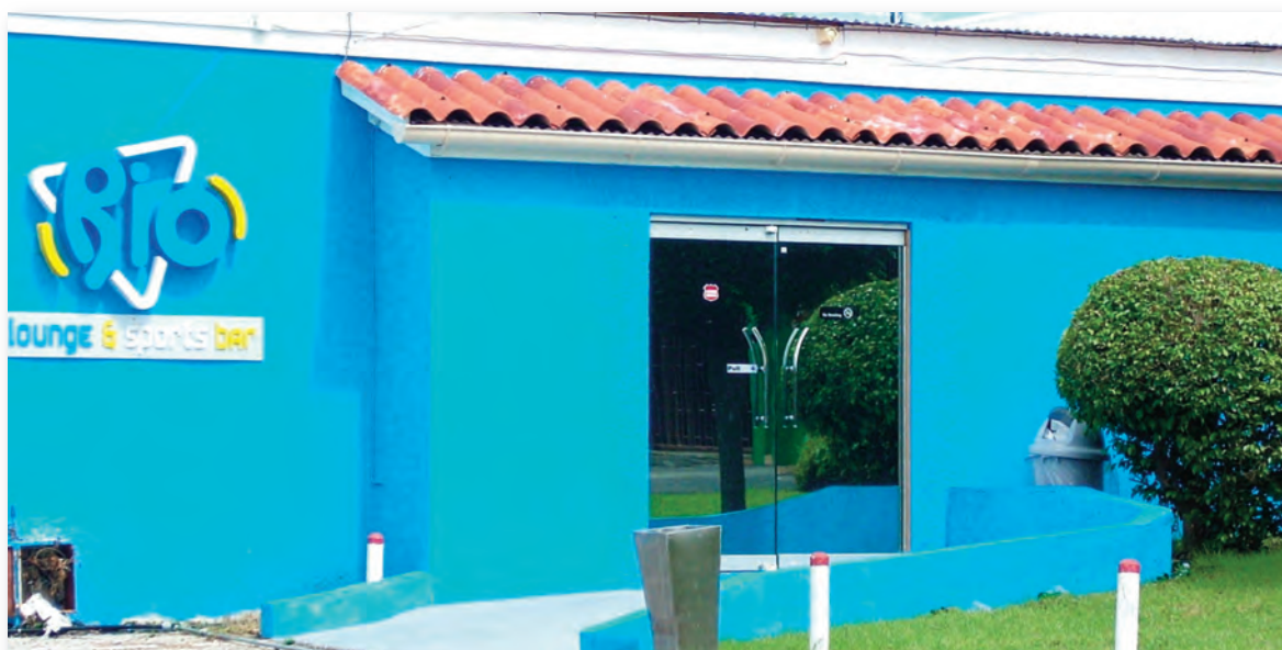
Bowlingclub te Damacor

De zone Mahaai heeft een klein aantal gelegenheden voor sport en spel. Zoals de Bowlingclub Damacor en een tennisbaan.