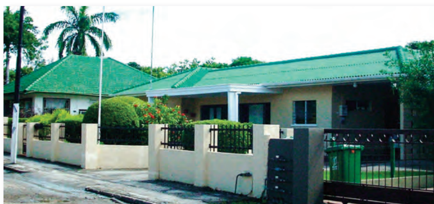
Huizen in van Engelen

Volgens bovenstaand tabel is het percentage huurwoningen per 100 eigendomswoningen in de periode 1992-2001 gedaald met 7 procentpunten tot 26.. Dit percentage blijft laag vergeleken met het landelijk gemiddelde van 44.