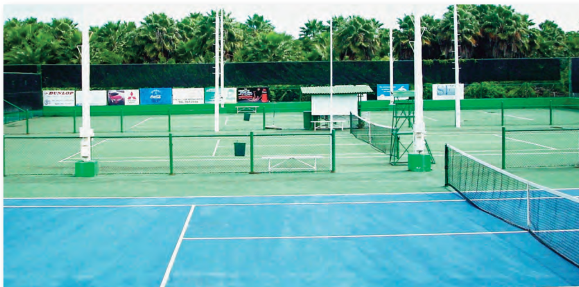
Tennisbaan te Damacor