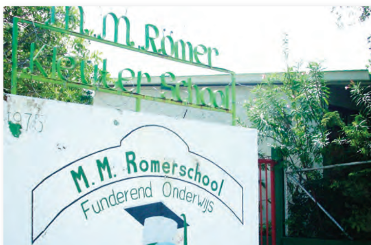
De ingang van de Römerschool

Het percentage analfabeten is in het jaar 1992: 2.9%. en in 2001: 1.1% Dit percentage laat een lichte daling zien van 1.8%. Dit is ongeveer de helft van het landelijk gemiddelde van boven de 3.6%.