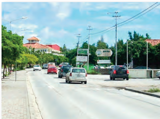
De Cas Coraweg

Dit betekent dat in deze zone weinig kinderen afhankelijk zijn van de bus om naar school te gaan vergeleken met het landelijk gemiddelde: in 2001 0,6 (Mahaai) vs 12.4 (Curaçao).