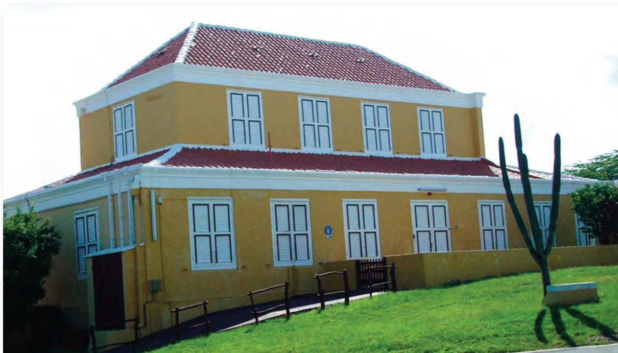
Landhuis Rooi Catochi