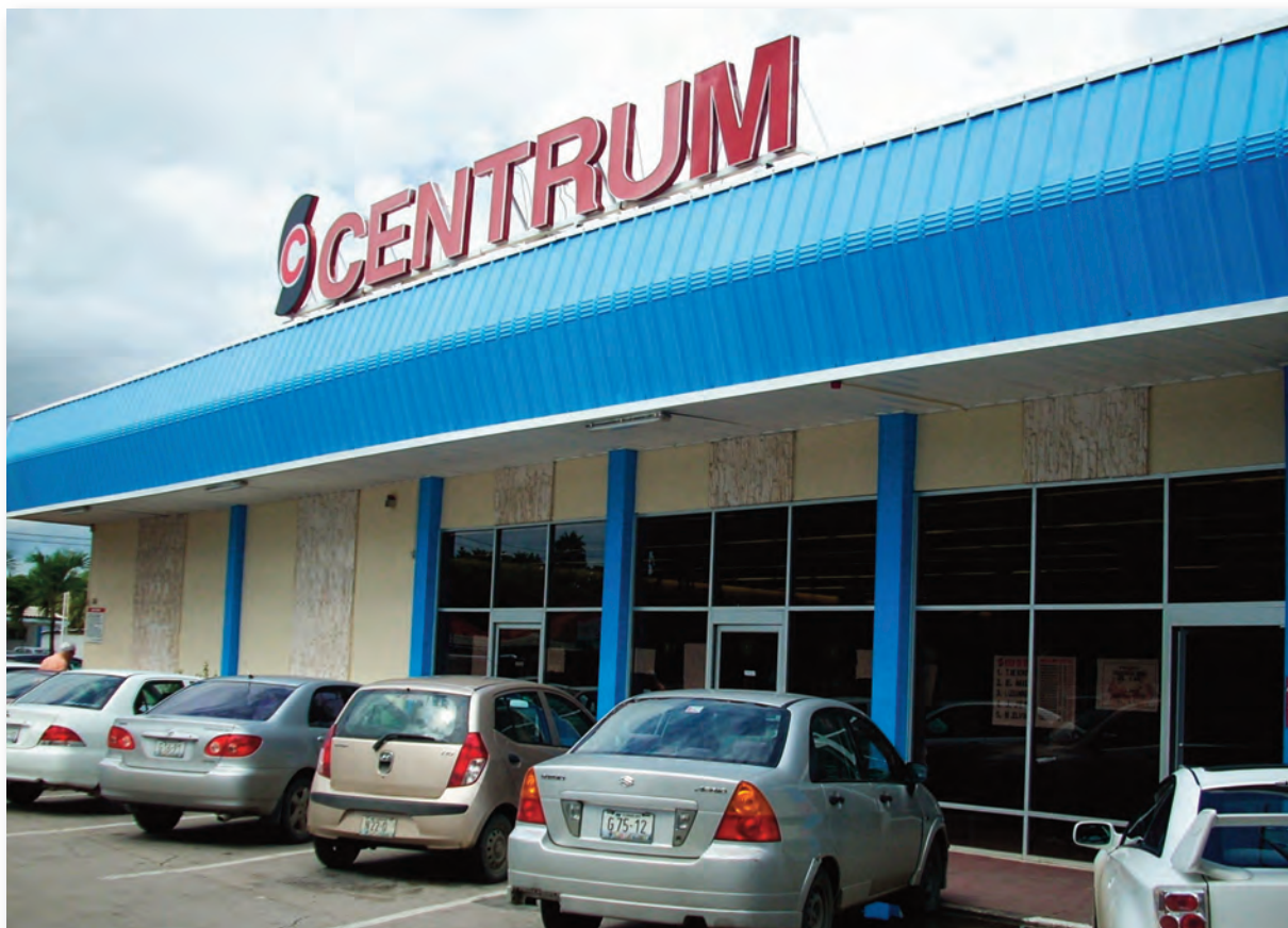
De Centrum Supermarket

Het percentage personen dat economisch afhankelijk zijn in de zone Mahaai daalt in de periode 1992-2001 van 113 tot 106. De afhankelijkheidsindex is 112. Dit betekent dat in deze zone het aantal economisch niet-actieven gedaald is. Tot de groep Economische Afhankelijken behoren Jongeren onder 15 jaar die nog niet werken en ouderen boven 65 jaar die niet meer werken.