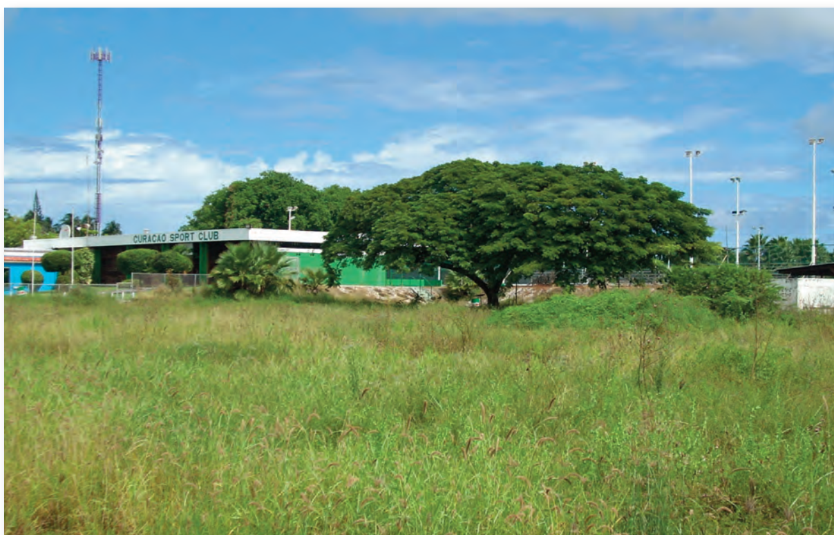
Verlaten Sportveld te Damacor

Het blijkt dat er een gemis is voor wat betreft accommodaties van sport- en spel. De wijk mist ook andere voorzieningen voor vrije tijd zowel voor jongeren als ouderen.