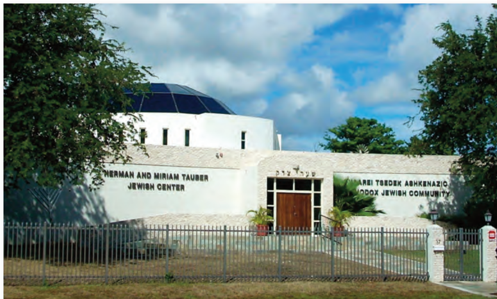
Joodse Synagoge aan de Magdalenaweg

Vergeleken met 1992 (12,7%) geven in 2001: 11,3% van de bewoners aan onkerkelijk te zijn.