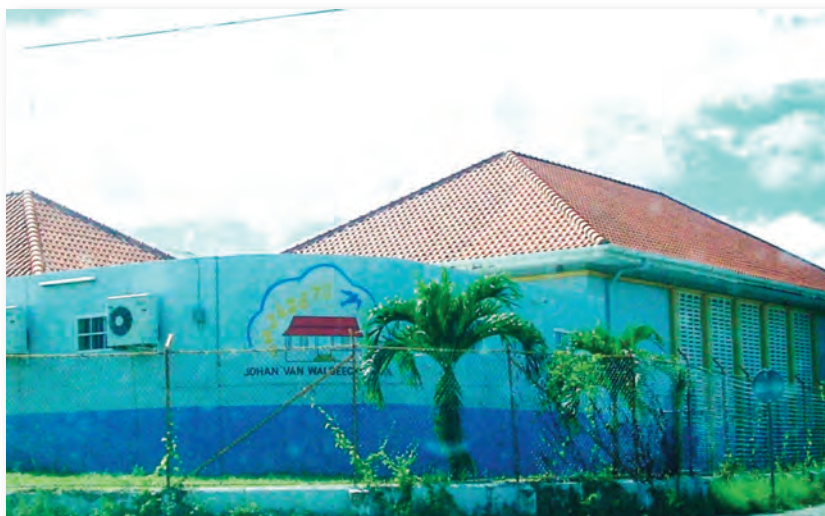
De Johan van Walbeeckschool

De schoolparticipatie van 15 t/m 19 jarigen in de zone Mahaai vertoont een dalende lijn, van 93.5 tot 90.1%. Desondanks is de schoolparticipatie van deze leeftijdsgroep bijna tien procentpunten hoger dan het landelijk gemiddelde dat in de periode van 1992-2001 toegenomen is van 72.5 tot 81.5%.